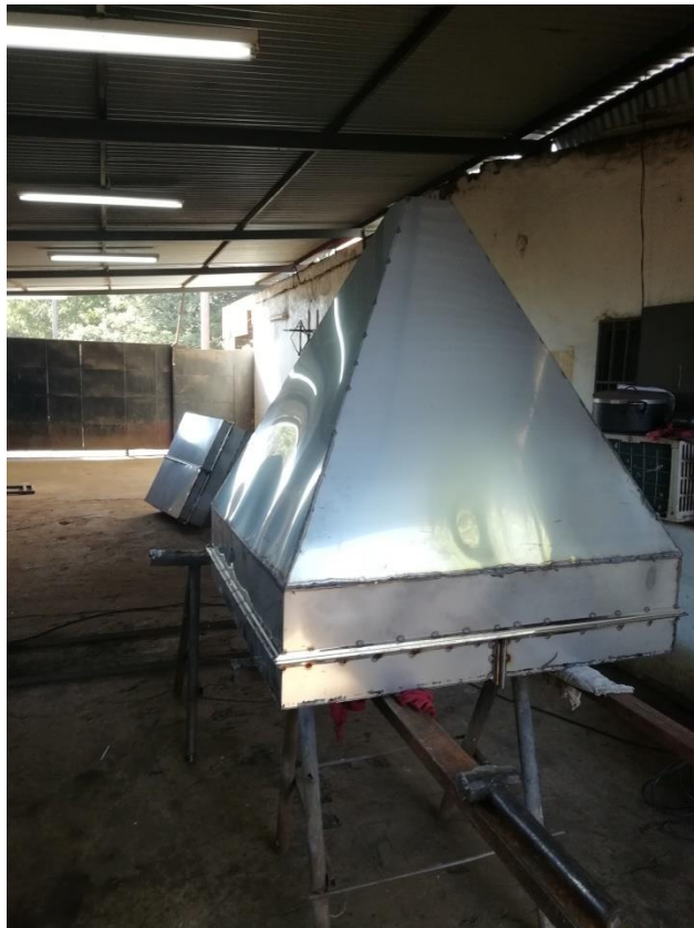
Tolvas de Acero Inoxidable