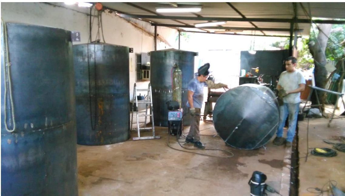
Fabricación de Tanques para Agua