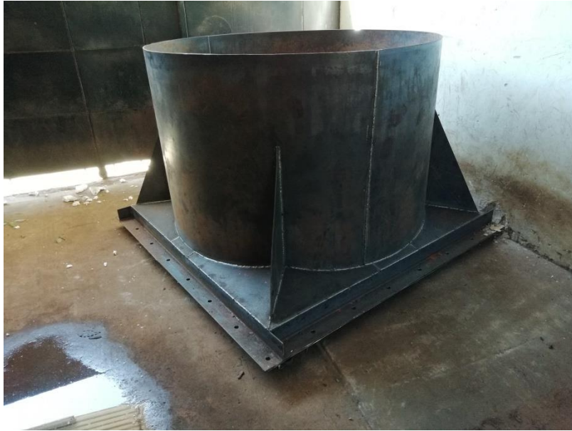
Base para Tanque cilindrico vertical