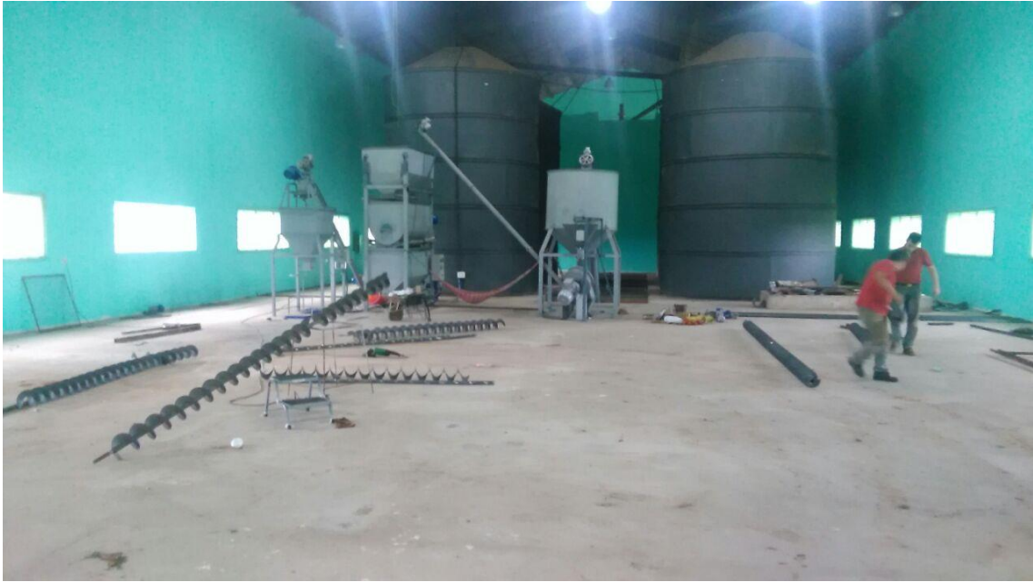
Reparacion de Tornillos Transportadores